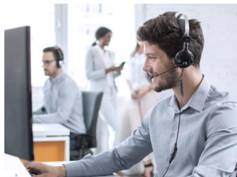
Nezahrnuje výše zobrazené přístroje a vybavení.

FossAssure™ a FossAssure™ Pro umožňují sledovat a optimalizovat výkon přístroje, snížit neplánované prostoje a zlepšit přesnost a ziskovost.